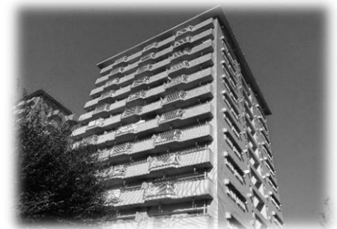
3-3棟は、今年3月に大規模修繕工事が完了しました。

お住み替えご希望のお客さまが所有している不動産の 売却 や 賃貸 に関して、お気軽にご相談ください。