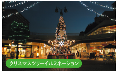
クリスマスツリーイルミネーション