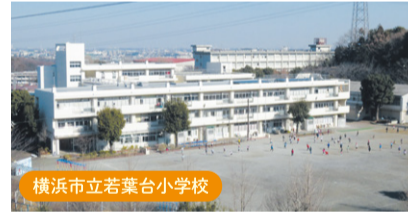
横浜市立若葉台小学校