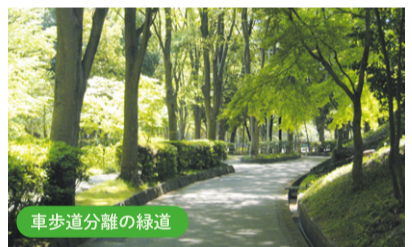
車歩道分離の緑道