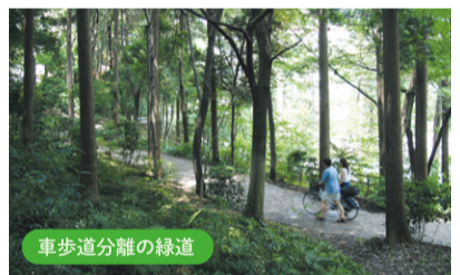
車歩道分離の緑道