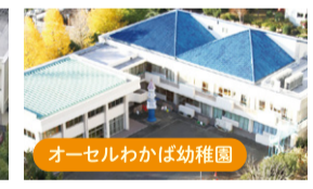
オーセルわかば幼稚園

(ショッピングタウン内) 『そらまめ』は、おもに0～3才の未就学児の親子が、気軽に集まり自由に過ごせる広場として、ともに育ちあえる、ほっとくつろぐ広場を目指しています。