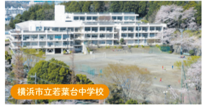
横浜市立若葉台中学校