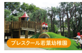
プレスクール若葉幼稚園

(ショッピングタウン内) 『そらまめ』は、おもに0～3才の未就学児の親子が、気軽に集まり自由に過ごせる広場として、ともに育ちあえる、ほっとくつろぐ広場を目指しています。