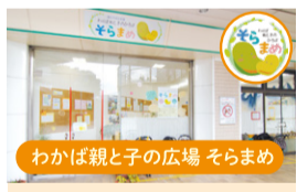
わかば親子の広場 そらまめ