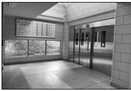
4-10棟エレベーターホール