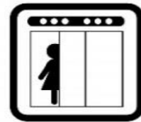
エレベーター 停止階