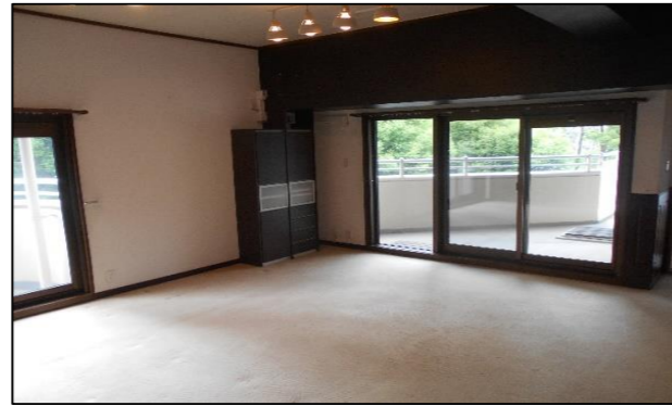
※モダンな色合いに統一されたリビングダイニング。