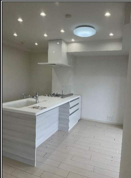
食洗器・浄水器付き水栓のオープンキッチン