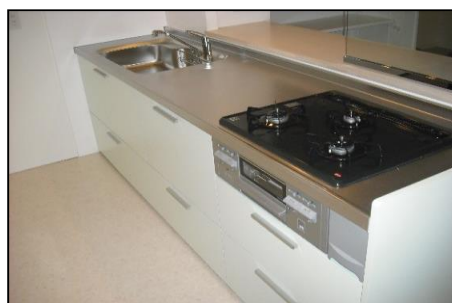
※交換済みのシステムキッチン。