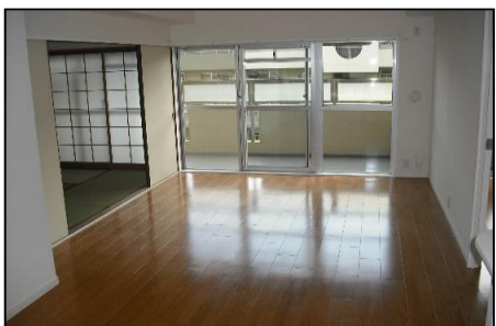
※フローリングのリビングダイニング。